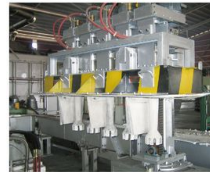
转子流槽除气装置 Rotor launder degassing equipment