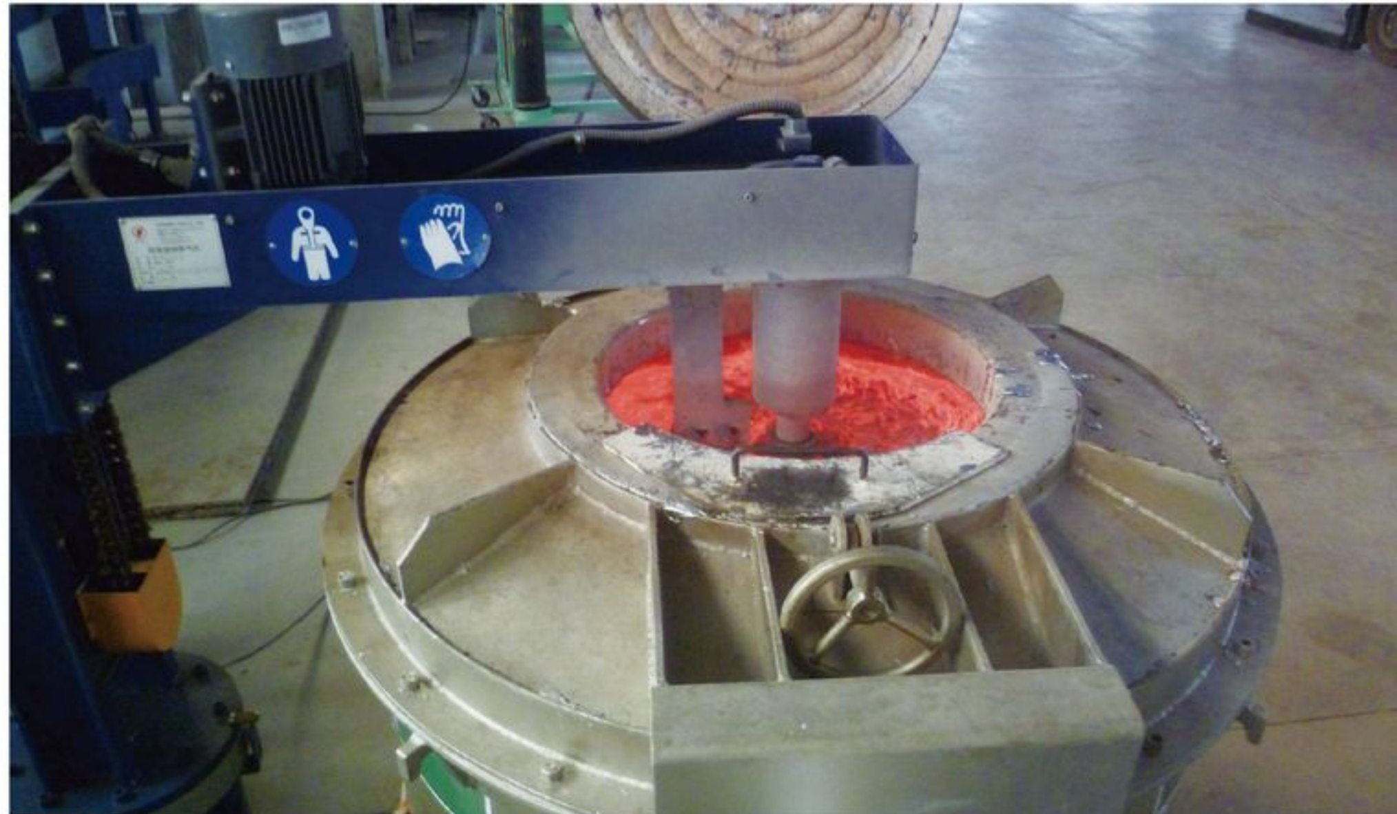
铝水精炼除气装置 Aluminum Degassing Equipment 专利号：201420181468.0、201420183209.1、201420181467.6

铝水精炼除气装置用于除去铝水中气体（主要是氢）以及氧化物（铝渣）。本装置适用于对坩埚、熔池、浇包、流槽中铝水的精炼处理。