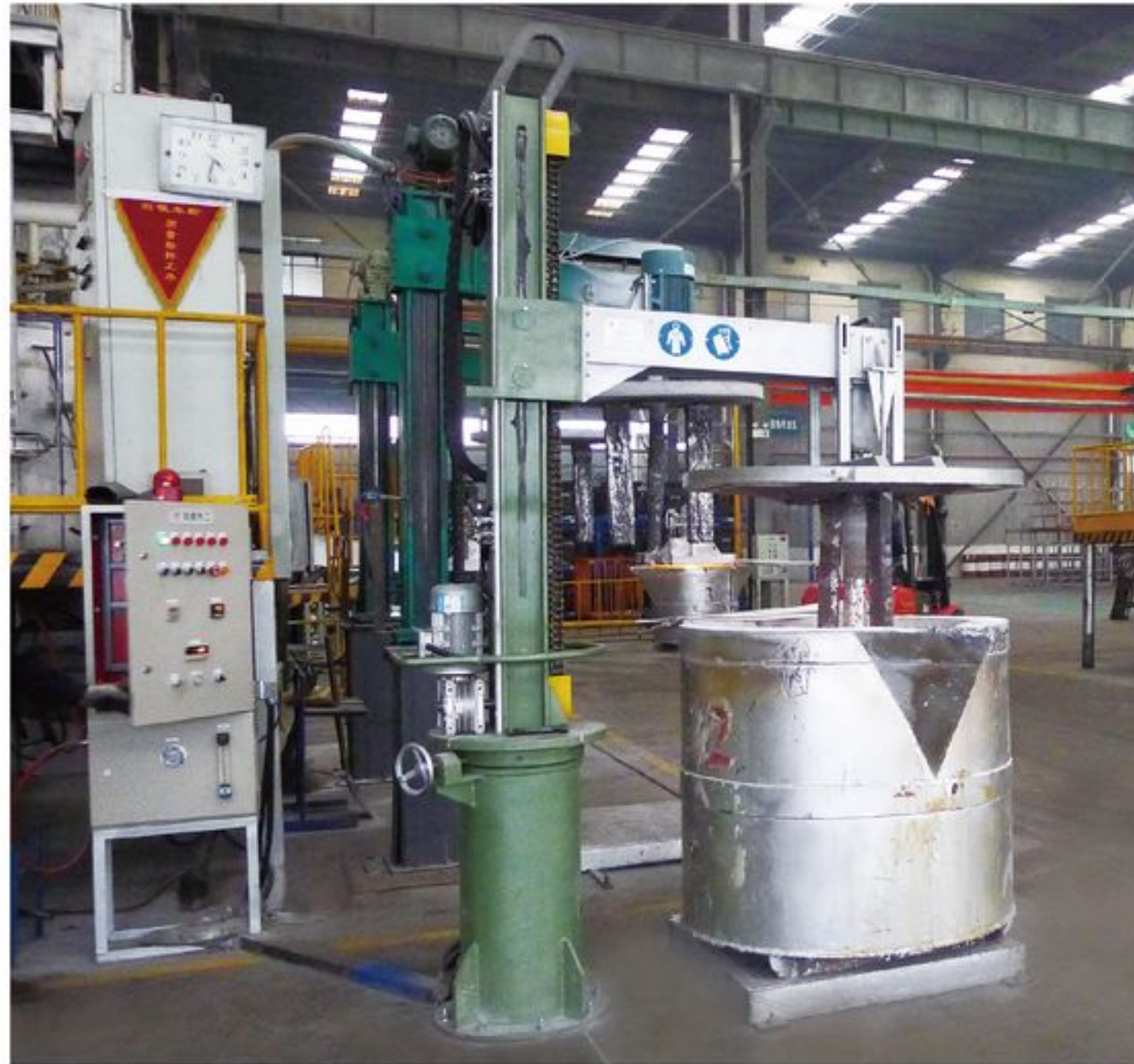
XC(P)220型固定式旋转喷吹除气机 Fixed rotary degassing and injection refining equipment