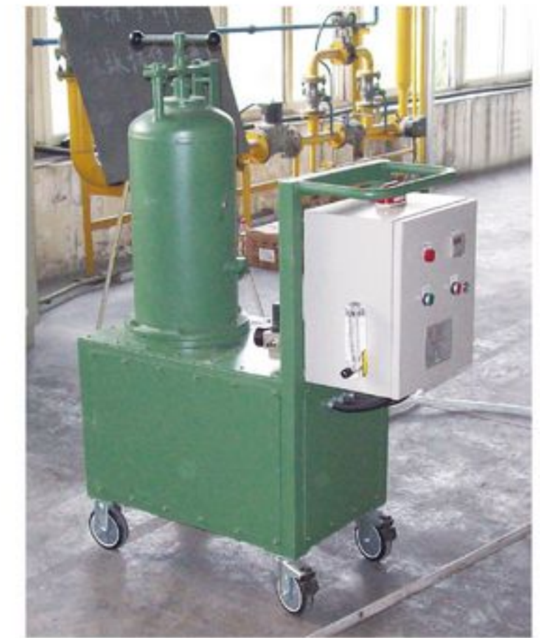
喷粉精炼机 Injection refining equipment