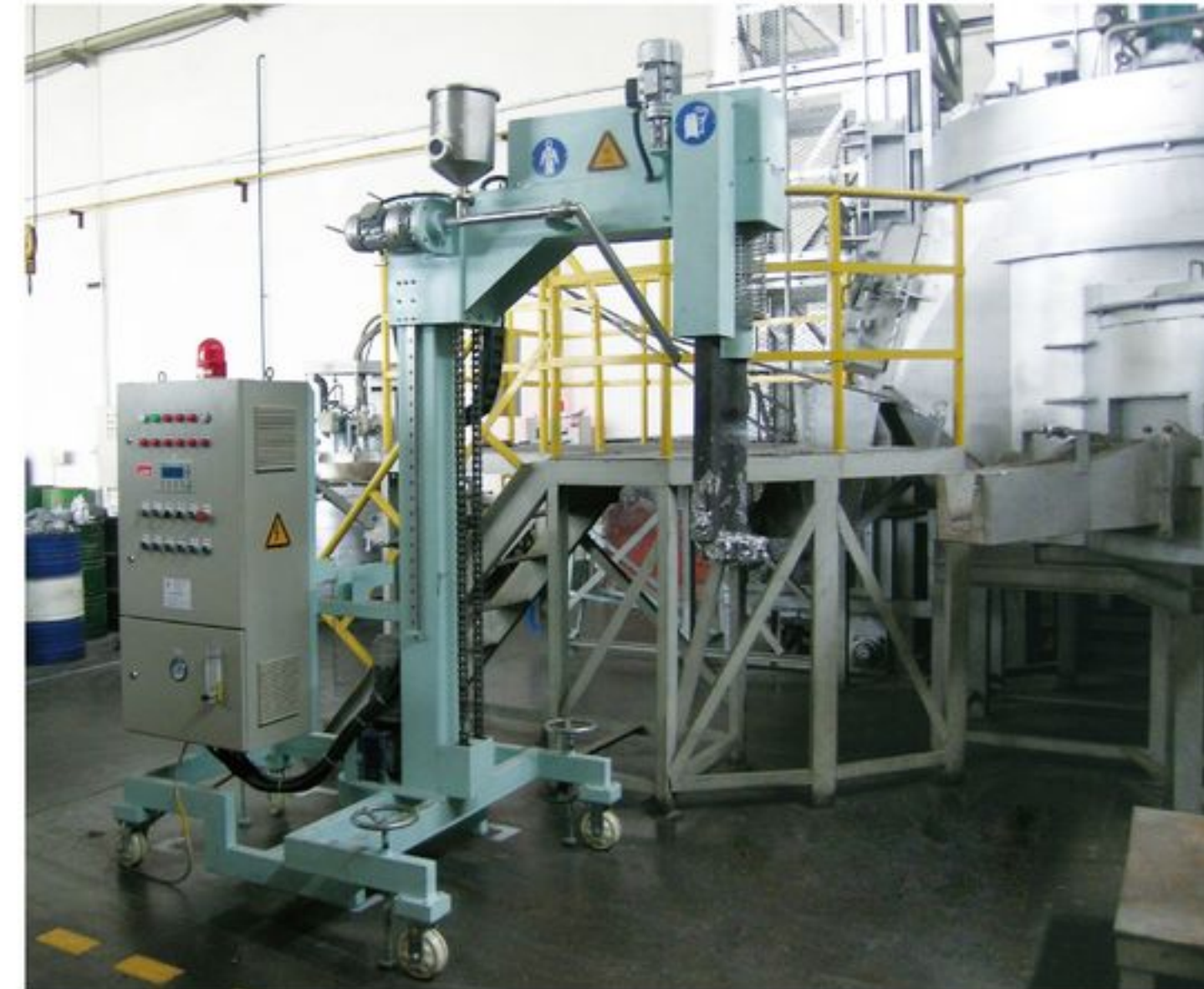
XC(P)210型移动式旋转喷吹除气机 Mobile rotary degassing and injection refining equipment