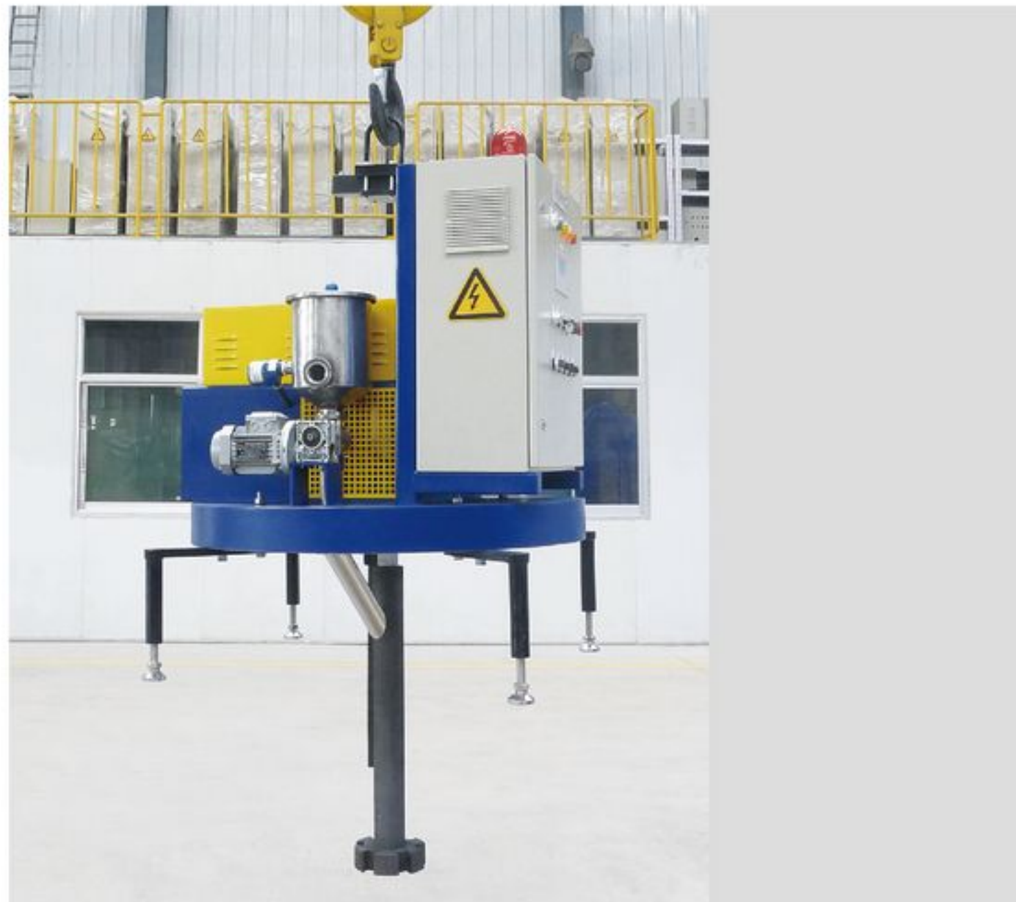
XC(P)100型悬挂式旋转喷吹除气机 Suspension type rotary degassing and injection refining equipment