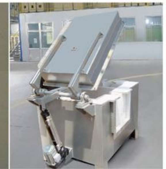
过滤箱 Filter boxes